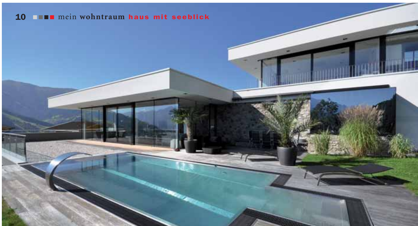
Dach- und Spenglerarbeiten stammen von der Dachbau GmbH.