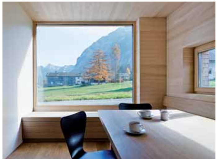
...und die Landschaft wohnt mit: Punktgenaue Ausblicke und tolle Einblicke durch die formschönen Fenster der Tischlerei Alexander Beer/Schnepfau.

hebt sich mit ihrer Edelstahl-Arbeitsplatte vom weiß und hellbraun dominierten Interieur ab. Eine frei schwebende mittig im Grundriss platzierte Holzterrasse führt ins Obergeschoss, das relativ einfach und günstig materialisiert wurde. Durch die Auskleidung mit schlichten Weißstannentäfer vermitteln die Schlafräume Schlichtheit und Geborgenheit.