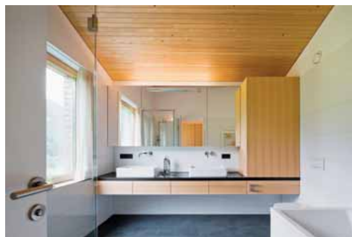
Klare Formen und Naturtöne harmonieren in den eleganten Innenräumen.

Architektur entsteht aus dem örtlichen Gefüge und prägt die Menschen über viele Jahrzehnte. Ich will die Vorstellungen und Wünsche der Bauherren umsetzen in einer modernen und nachhaltigen Art, die sich der ländlichen Umgebung anpasst“.