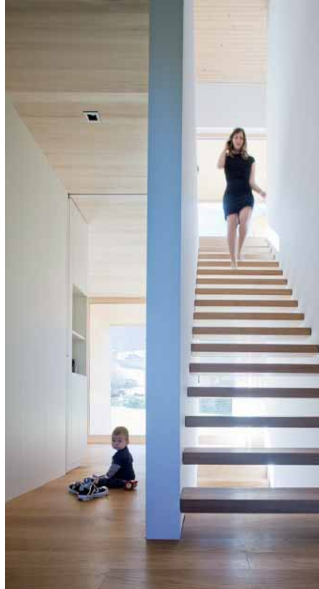
Familienleben in Naturidylle: Architektur entsteht aus dem örtlichen Gefüge und prägt die Menschen.

Abschluss. Die Architektur des zeitlos-modernen Gebäudes knüpft an die Bautradition des Bregenzerwaldes an und entwickelt den Formenschatz der Wälderhäuser eigenständig weiter.