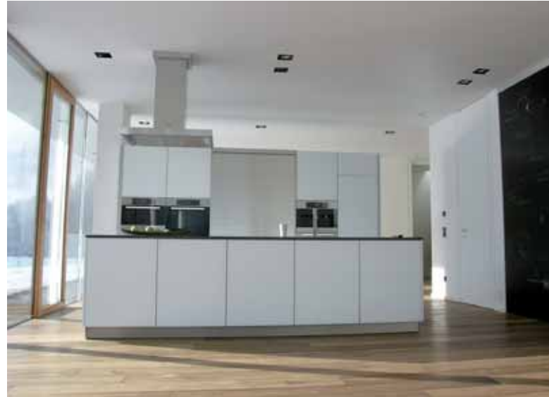
Schlichtes, klares Design dominiert auch den Koch- und Essbereich.

als Vordach zum Schutz vor zuviel Sonneneinstrahlung im Hochsommer. In den Übergangszeiten gelingt dann die passive Nutzung der Sonnenenergie durch die Transparenz der Fassaden. Spektakuläre Aus- und Durchblicke ermöglicht die offene Raumeinteilung. Direkt zum Garten hin orientiert sich der großzügige Wohn-, Ess- und Kochbereich. Weiße Küchenfronten mit Glasoberflächen, einer kommunikativen Schiefertafelwand und einer Kochinsellösung mit schwarzer Granit-Oberfläche in „Leather“-Optik harmonisieren perfekt mit den handgehobelten Eichendielen. In den Schatten gestellt wird das puris-