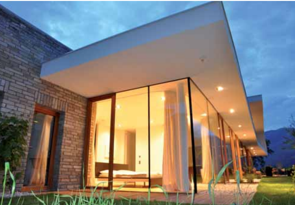
Die Hauptwohnebene wird vom Garten erweitert.